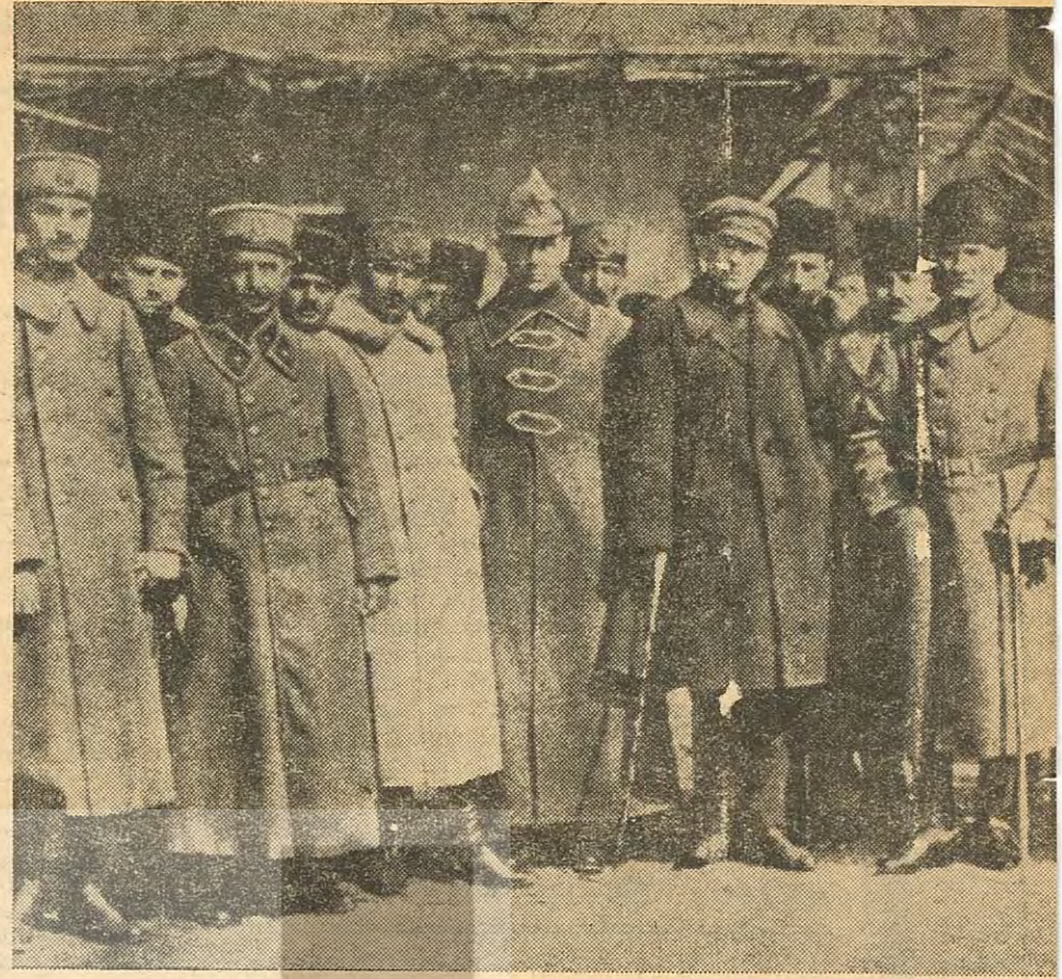
Sovyet ve Azerbercan temsilcileri Akşehir'de Mustafa Kemal ve İsmet Paşa ile birlikte.

Yeşil Ordu Cemiyeti, hükümete resmi bir beyanname vererek kurulmuş olmasına göre, gizli bir teşkilâtı; ama Mustafa Kemal'in bilgisi dışında değildi. Zaten onun yakın çevresinden gelen kişiler tarafından kurulmuştu. Fakat Çerkez Etem'in bu teşkilâta katılması ve Yeşil Ordunun eline ciddi bir silâhlı kuvvetin geçmesi üzerine, Mustafa Kemal, cemiyetin faaliyetini durdurmak için harekete geçmiştir. 1920 yılındaki