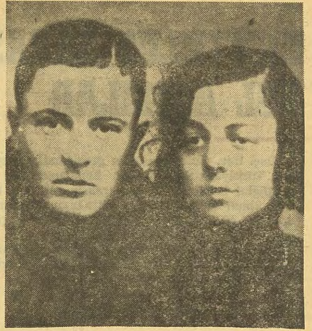
Nazım Hikmet ve NT (Moskova 1921)

— Tabii. Ona ait sayfalar, daha doğrusu beraber geçen hayatımız bu kitabın en renkli sayfalarıdır. Bir yerinde ve geceleri Orman Ateşi etrafında geç saatlere kadar süren üç kişilik tartışmalarımızı anlatırken şöyle yazıyorum: «Muhakka ki, bu azılı insanın derisinde, içindeki kanı zaptedemiyen âsi damar