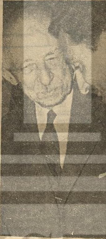
İnönü - Ecevit «Defterleri dü rüldü» Çin'de neler oluyor?

Dış haberlerle hiç ilgilen meyen basınımız, son zaman lar da fantezist Çin haberleri ni mansette vermeye başla mıştır! Tokyo mahreclî, bü