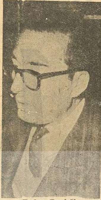
Turhan Feyzioğlu Truva Atı